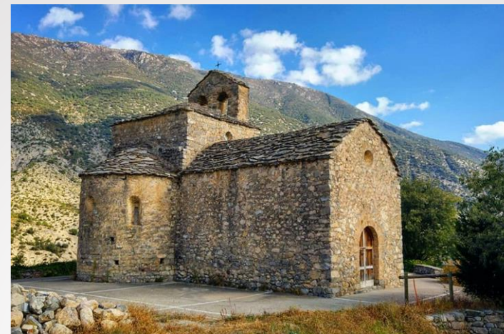
Església romànica de Sant Serni. S XI.

El Centre d'Interpretació de l'església romànica de Sant Serni té com a objectiu donar a conèixer, mitjançant una exposició al seu interior i visites guiades, tres aspectes clau del patrimoni històric i cultural de la Vall de Cabó: