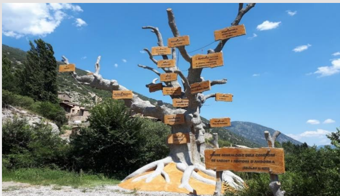
Arbre genealògic dels senyors de Caboet a Cabó, creat per Lluís Bossa.

Els Caboet foren un llinatge feudal originari de la vall de Cabó, d'on els prové el nom, datat de mitjan segle X al principi del XIII. Des de la segona meitat del segle XII entre les seves possessions s'hi trobaven les valls d'Andorra.